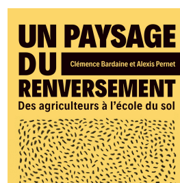
Un paysage du renversement. Des