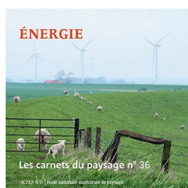
Les carnets du paysage N°36 -