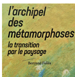
L'Archipel des métamorphoses. La