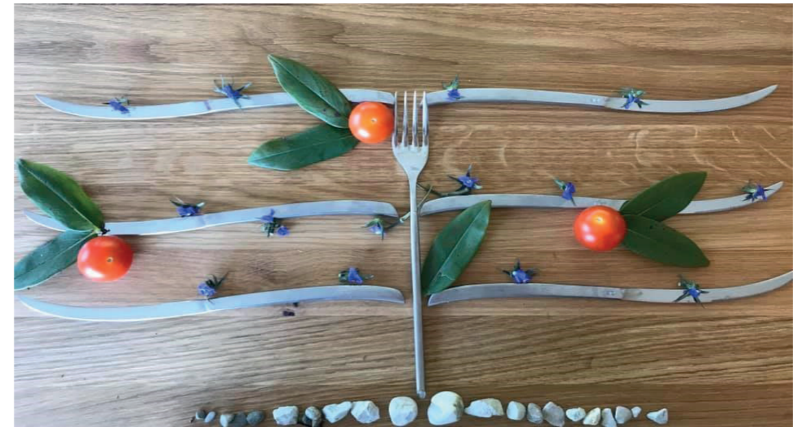
Palmette horizontale à trois étages, en couverts !

Essaye de reproduire une taille fruitière, ou d'en imaginer une autre avec des objets du quotidien, en t'aidant des photos ci-dessous :