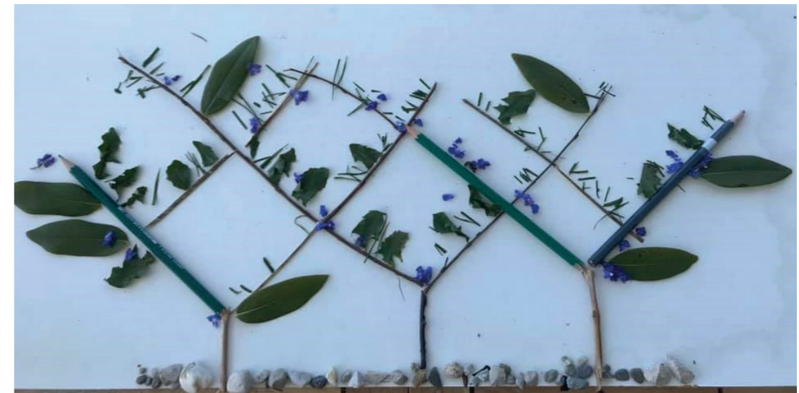
Tricoisillons, en feuilles et crayons !