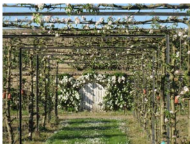
Le Potager du Roi en fleurs