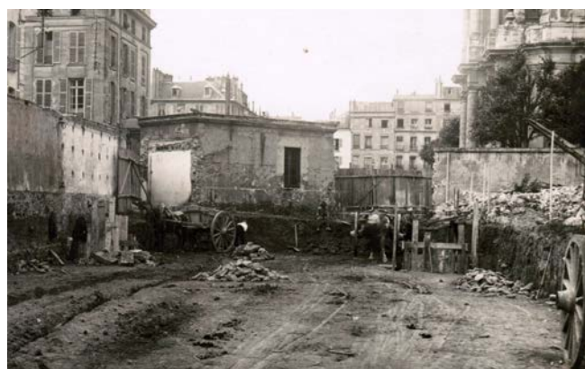
Deux photographies d'avant 1926. Derrière la publicité BYRR, le parking actuel du Potager du Roi. Vue de ce même espace de l'intérieur. Terrassements en préparation de la construction du bâtiment actuel Saint Louis.