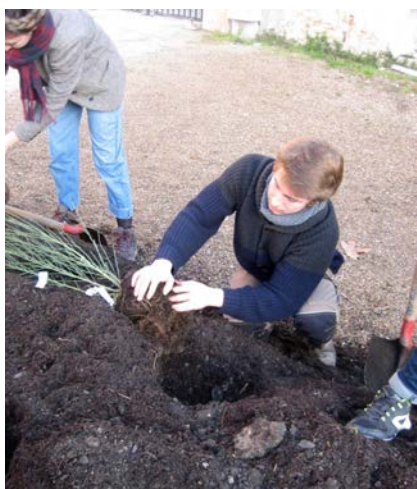
Moment de plantation

Les préparatifs d'envergure en valaient la peine, à considérer le bon déroulement de cette journée du 9 décembre et la mise en œuvre de la plate-bande. De là, espérons que marcottent et drageonnent d'autres idées sur ce parking.