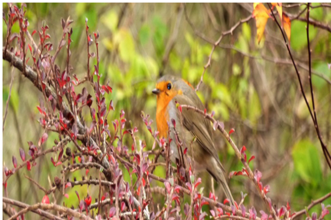
Rouge gorge au Potager du Roi cet hiver

par Jean-Pierre Thauvin, membre de l'Association des naturalistes des Yvelines (ANY)