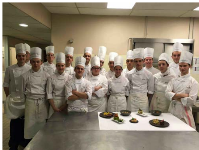
Les élèves et leurs inventions

Bulletin assemblé et composé par Antoine Jacobsohn et mis en page gracieusement par Geneviève Gnana.