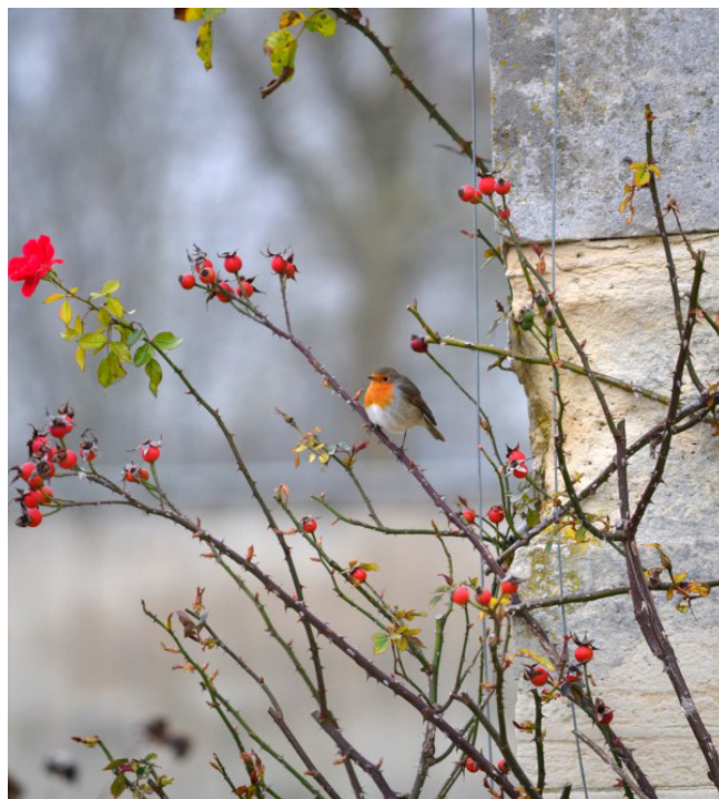
Rouge gorge au Potager du Roi

Les hommes m'aiment bien. Ils sont curieux et apprécient me regarder me nourrir sur les mangeoires mises à notre disposition ou sur les boules de graisse.