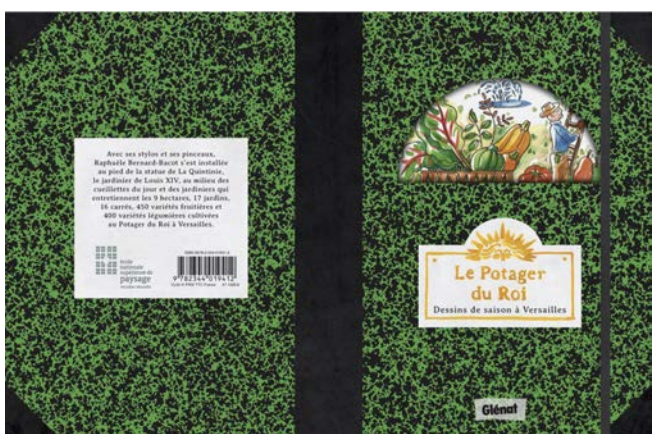
Le Potager du Roi. Dessins de saison à Versailles. Sortie le 12 avril 2017 Texte et dessins de Raphaèle Bernard-Bacot.

Le carnet dessiné d'un voyage de trois ans parmi les 9 hectares, 12 jardins, 16 carrés, 450 variétés fruitières et 400 variétés légumières cultivées par les jardiniers du Potager du Roi à Versailles.