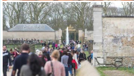
Esprit jardin en 2016