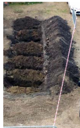
Vue du parking et des préparations. Les sondages transversaux ont une allure d'enterrement !

Là, à proximité du mur oriental séparant le parking de la rue Maréchal Joffre, une fosse de onze mètres de long sur deux de large, creusée quelques jours plus tôt à la mini-pelle, attendait les étudiants ; une occasion de s'intéresser, en préalable à toute intervention, à quelques données pédologiques. Ayons le réflexe d'explorer ce que nous avons sous les pieds avant même de planter !