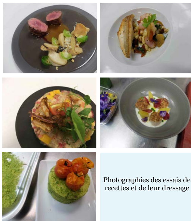
Photographies des essais de recettes et de leur dressage

Un grand remerciement au directeur de Ferrandi et surtout aux enseignants et aux élèves.