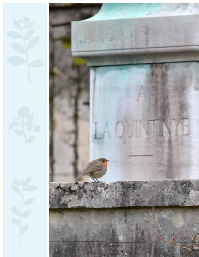
Rouge gorge au Potager du Roi

Laissez-moi vous conter une courte histoire : il y a quelques années de cela, une bande d'individus qui passent leurs loisirs à nous attraper pour nous poser un anneau de métal à la patte, m'ont capturé en région parisienne. Eh bien, j'en étais déjà équipé ; quand ils ont lu ce qui était écrit sur la mienne ils ont été ébahis : je venais d'arriver des pays Baltes et j'avais parcouru 100 km par jour en moyenne. Comment le savaient-ils ? L'information leur a été communiquée quelques temps après par les services internationaux qui régissent cette activité. J'avais été bagué au nid 18 jours avant. Cela vous en bouche un coin n'est-ce pas !