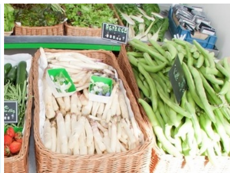
Avec le printemps, l'arrivée des asperges et des fèves

Pour en savoir plus : www.potager-du-roi.fr