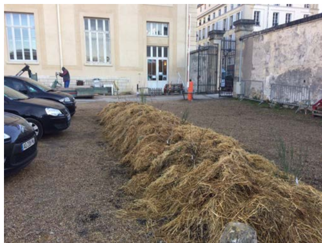
une vue du paillage

Les préparatifs d'envergure en valaient la peine, à considérer le bon déroulement de cette journée du 9 décembre et la mise en œuvre de la plate-bande. De là, espérons que marcottent et drageonnent d'autres idées sur ce parking.