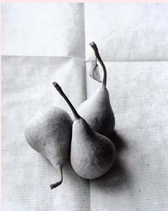
Poire 'Ah ! Mon Dieu' (une variété du 17 e siècle)

Jean-Charles Vaillant est photographe depuis 1975. Il est passé par l'École des Beaux-arts de Nancy et l'École Louis Lumière. Il aime le soleil sur l'écorce des hêtres, une pêche pochée dans un sirop de verveine, la présence complice de ceux qui se laissent photographier. Le temps est présent dans l'instantané de la prise de vue.