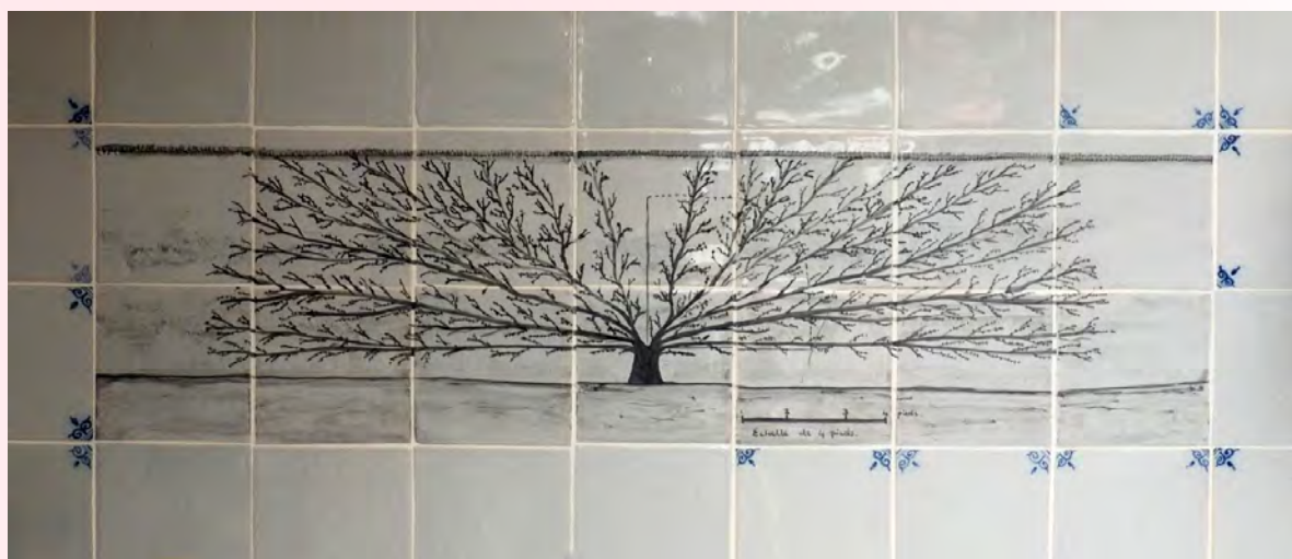
Dans la cuisine de la bibliothèque d'Oak Spring Garden Foundation