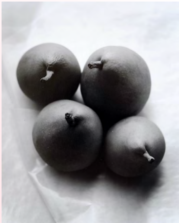
Poire 'Grand Champion' (une variété du 20 e siècle)